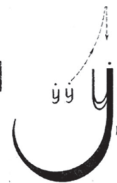
Рис. 6. Музыкально-графическое изображение игры «Ворон»

протяжённостью. Изучение алгоритма начинается с упражнений, песен-игр , в которых задания даются в расщеплённом виде – «узлами». И только после качественной проработки этих звеньев, всё собирается в единый вокальный этюд.