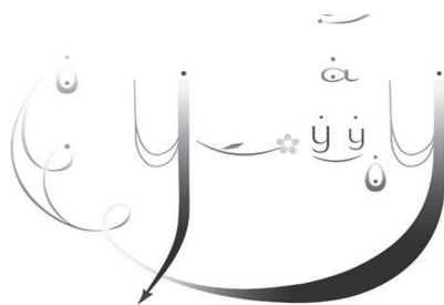
Рис. 1. Сводный алгоритм методики Д. Огороднова

школе, относятся: художественное тактирование; вокально-ладовые жесты; алгоритм (вокальное задание, заключенное в схему) (рис. 1).