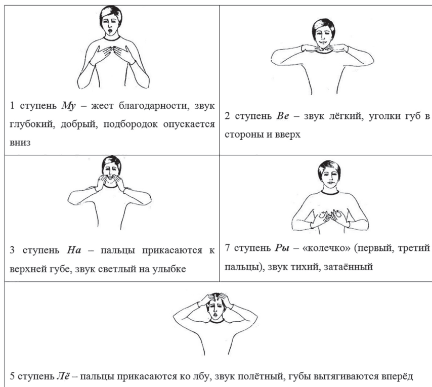
Рис. 3. Примеры вокально-ладовых жестов

Установим порядок включения неустойчивых ступеней: вторая ступень удобна тем, что она укрепляет мост между первой и третьей; седьмая ступень создаёт наиболее благоприятные