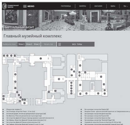
Фото 3. Презентація віртуального візиту до Ермітажу