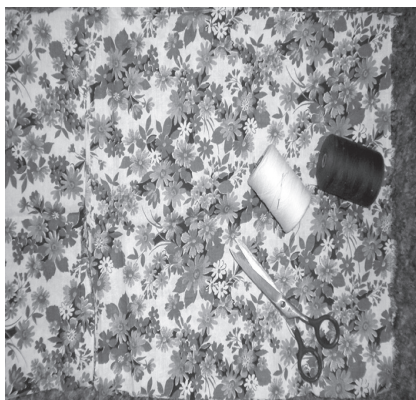
Фото 1. Беремо квадратний клаптик тканини (30 x 30 см), ножиці, нитки

Пропонуємо долучитися до чарівного дійства виготовлення ляльки-