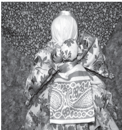
Фото 8. На ляльку вдягаємо фартух, на голову пов'язуємо косинку