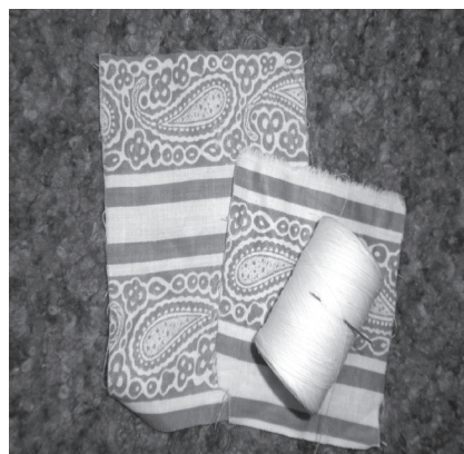
Фото 6. Для фартуха беремо клаптик 9 x 9 см, обробляємо краї, прикріплюємо пояс