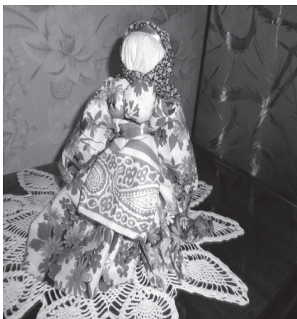
Фото 9. Оздоблюємо ляльку

мотанки з характерними особливостями Полтавського регіону (фото 1-9).