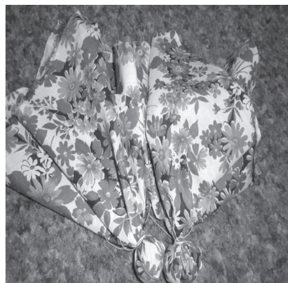
Фото 5. Для формування грудей у центр квадратних клаптиків кладемо наповнювач та зав'язуємо вузликом