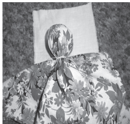
Фото 4. Якщо тканина кольорова, поверх неї накладаємо шматок білої тканини (8 x 8 см) для обличчя і прив'язуємо ниткою