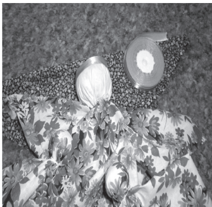
Фото 7. Прив'язуємо груди вище талії. Обвиваємо тканиною нижню частину тулуба, формуючи спідничку. Надягаємо ляльці начільний обруч та пов'язуємо зверху косинку