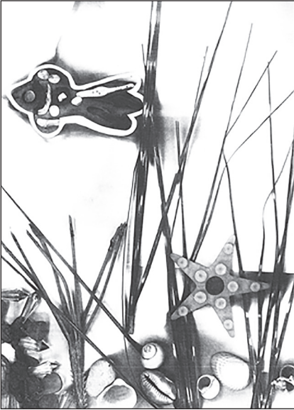
Мал. 1. «Мандрівка крихітної рибки»