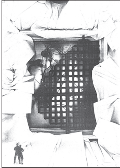
Мал. 2. «Роздуми про навколишній світ»