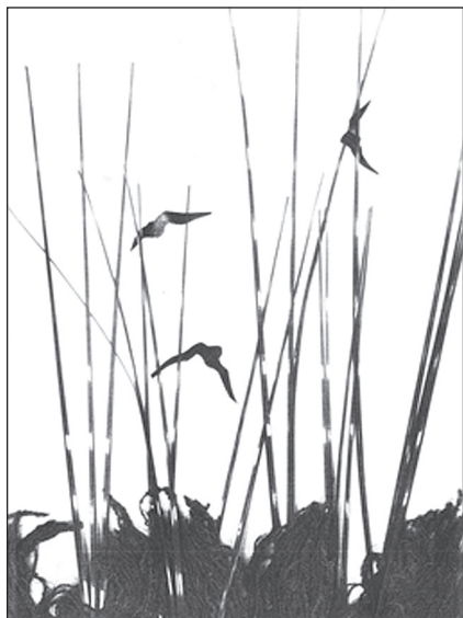
Мал. 4. «На полюванні»

– домальовувати різними графічними матеріалами – олівцями, крейдами та ін. Педагог може використати такі роботи для обговорення з учнями правил композиції – у кого як вона вибудована, наскільки точно вона відповідає задуму учня та ін. – це надзвичайно корисний етап навчання образотворчого мистецтва. Таке обговорення стимулюватиме творчу уяву школярів – вони побачать багато образів і їх втілення різними матеріалами.