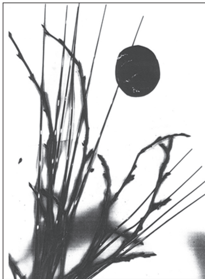
Мал. 5. «Таємниця думок»

Запропонована нами графічна техніка ксерографіки може бути ефективно використана з різною метою – навчальною (оскільки дозволяє знайомити дітей з правилами композиції, виразними засобами – ритмом, формою та ін.), розвивальною (сприяє розвитку творчої уяви, фантазії, вчить використовувати різні матеріали у творенні відтисків), творчою (розвиває творчі здібності). Долучитися до створення зображень у цій техніці можуть діти вже з молод-