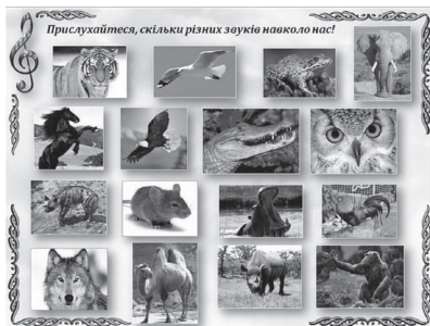
Фото 2. Заготівка для групової роботи

ням звуків – високих і низьких (фото 1). Вчитель пропонує учням розкласти ці картки по відповідних кишенях для високих чи низьких звуків (робота дітей з картками і класним лепбуком).