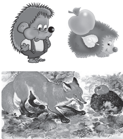
Фото 3, 4, 5. Приклади карток із зображенням їжачка

Учитель заздалегідь розкладає три картки із зображенням тваринки і пропонує учням уявити, якими можуть бути їжачки, пригадати, де вони живуть, чим живляться, що полюють роби тощо. Учні по черзі виймають картки із кишеньок і придумують відповідно до