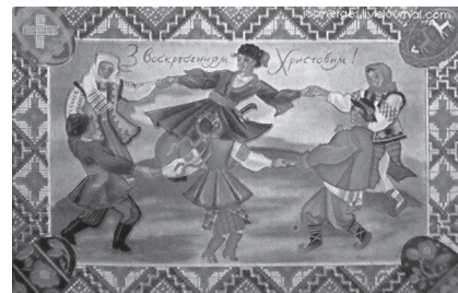
Фото 7. С. Гординський. «З Воскресінням Христовим!»

що листівки здаються рельєфними [5, с. 123] (фото 7).