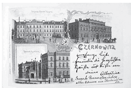
Фото 8. Автор невідомий. «Czernowitz»

Довершена листівка – зроблена вручну чи за допомогою комп'ютерних програм – повинна бути проста за своєю композиційною будовою. На маленькому форматі багатокольорність і складність композиції небажані, оскільки через них легко втратити головний задум зображення і зміст вітальної листівки. Перевантаженість зображальними елементами і кольорами не дозволить акцентувати увагу на написі чи тексті. Елементами композиції вітальних листівок можуть бути різноманітні форми, у тому числі сюжетні, умовні, символічні зображення й декоративно-орнаментальні прикраси (їх можна відшукати в Інтернеті); однак важливо відчувати домірність у їх використанні та пам'ятати про загальну стилістику зображення – еkleктичне поєднання різних символів, фрагментів дає гарний результат тільки за наявності досвіду і особливого художнього «чуття». То якщо ви новачок у цій справі, краще оберіть один стиль. Часто для передавання емоційного ставлення до адресата використовують смайлики (англ. smile – усмішка) – символи, що нагадують обличчя із різними емоціями, їх доцільне використання додає «родзинки». Однак, слід уникати їх у діловому листуванні та спілкування з малознайомими людьми, які можуть неправильно трактувати ваш «посил». З цієї ж причини слід бути обережними із використанням готових зображень