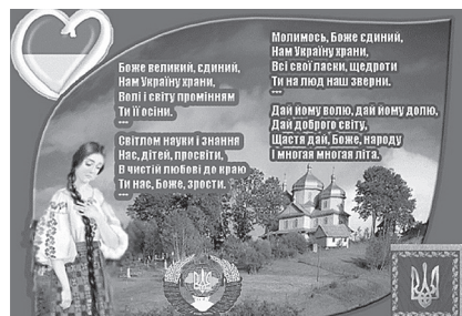
Фото 9. Плейкаст «Молитва за Україну»