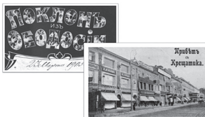
Фото 4. Дореволюційні листівки

Досліджуючи листівки С. Гординського, звертаємо увагу на щедрі орнаменталію із багатим колористичним вирішенням, яке автор запозичує з гуцульських різьблених виробів, писанкових мотивів і передає їх так вдало,