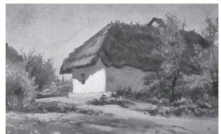
Фото 2. Е. Вржешь. «Хата на Україні»