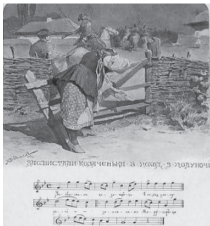
Фото 3. А. Ждаха. «Засвістали козаченьки в похід з полуночі...»

(Е. Вржещь. «Хата на Україні», А. Ждаха. «Засвістали козаченьки в похід з полуночі...») є своєрідним наочним матеріалом для вивчення української культури і мистецтва [4, с. 92] (фото 2, 3).