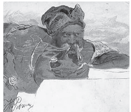
Фото 1. І. Рєпін. «Запорожець»

Зразки української філюкартії стали для сучасників справжнім джерелом знань про українське мистецтво, культуру, історію. Так наприклад, окремі листівки з колекції Калини Гузар