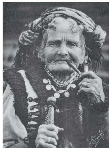
Фото 6. М. Сеньковський. «Стара гуцулка». Фотолістівка відзначена гран-прі Міжнародної європейської фотовиставки в Парижі, 1931 р.