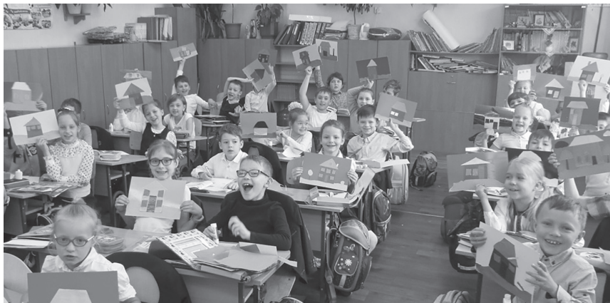
Фото 8. Першокласники наприкінці уроку мистецтва

«Жила-була Лінія. Вона могла набирати різного вигляду. Коли в неї був гарний настрій, вона ставала хвилястою,