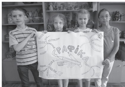
Фото 1. Створена учнями 3-го класу інтелект-карта

« Кубування » – це метод навчання, що полегшує всебічний розгляд теми учнями (автори Кован та Кован, 1980 р.). Метод передбачає використання кубика, який можна виготовити самостійно з цупкого картону або використати готовий, попередньо обклеївши його папером. На кожній грані кубика потрібно написати наступні вказівки: 1. Опишіть. 2. Порівняйте. 3. Встановіть асоціації. 4. Проаналізуйте. 5. Знайдіть застосування. 6. Запропонуйте аргументи «за» або «проти». Використовуючи метод «Кубування», вчитель пропонує учням відповіді на шість запитань різних типів, що стосуються теми. Замість написів на гранях можна використовувати малюнки. Однією з модифікацій цього методу на уроках мистецтва в початковій школі може бути використання кубика із зображеннями на гранях художніх матеріалів, музичних інструментів тощо. Так, вивчаючи різні види мистецтва, учням пропонується обрати малюнок на одній з граней кубика (пензлик, олівець, будиночок, картина у рамі,