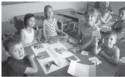
Фото 6. Лепбук як результат учнівської творчої роботи

Лепбук (з англ. lap – коліно, book – книга) – це саморобна інтерактивна папка, в яку збираються і яскраво оформлюються різноманітні пізнавальні матеріали з певної теми вивчення. Лепбук обов'язково має різні за розміром кишеньки, вставки, рухливі деталі, віконця, міні-книжечки тощо з цікавою інформацією щодо предмета вивчення. Чим більше складових, тим більш інформативною є тека, а завдяки різнобарвній візуалізації зміст навчального матеріалу краще запам'ятовується. Мета створення: для повторення та закріплення навчального матеріалу з теми або кількох тем тематичного блоку; для формування оцінювання в якості портфоліо; для навчання інших – учнів молодших чи паралельних класів; для організації індивідуальних учнівських презентацій або створення проєктів у парах чи малих групах.