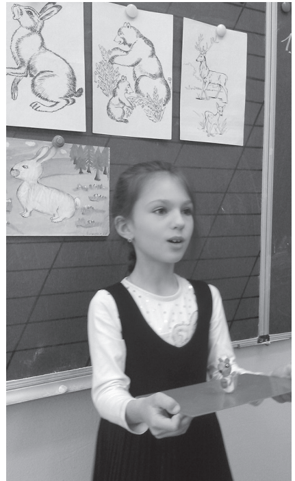
Фото 7. Метод «Сторітеллінг» на уроці у 2-му класі

Так, під час створення лепбуків з теми «Скульптура» у 3-му класі вчитель ділить клас на групи (по 5–6 учнів), допомагає розподілити ролі (командир, шукачі інформації, відповідальні за кишеньки, ножиці, клей, оратор-презентатор). Кожній групі можна запропонувати схему майбутнього лепбука (яка у процесі роботи зазвичай змінюєть-