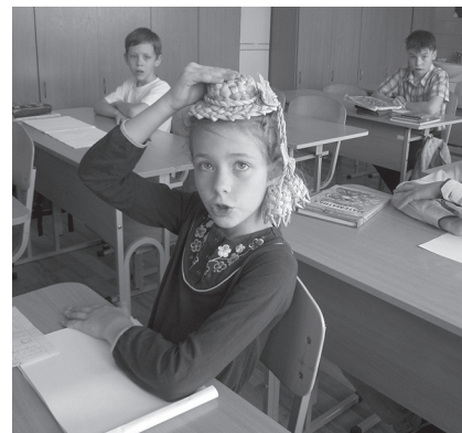
Фото 3. Метод «Допитливий капелюх» на уроці у 2-му класі