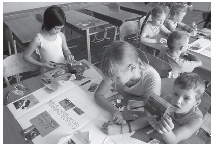
Фото 5. Створення лепбука учнями 3-го класу

Одним із методів, що дозволяє здійснювати навчання в ігровій формі, є лепбукінг . Як показує практика зарубіжних шкіл, лепбукінг – ефективний освітній метод, який дозволяє розвивати різносторонню творчу особистість. Адже не дарма його широко використовують в навчальних закладах різних країн. Про використання лепбука на уроках мистецтва в початковій школі детально розповідається у статті Овінікової Н. І. [9].