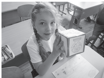
Фото 2. Метод «Кубування» на уроці образотворчого мистецтва у 2-му класі