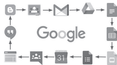
Рис. 2. Інструменти Google в освітній діяльності

ляє зміст програми навчання педагогів сформувати із послідовних модулів, відповідно до потреб і запитів слухачів курсу; індивідуалізація навчання – передбачає забезпечення індивідуальних освітніх потреб; економічність дистанційного навчання – завдяки ефективному використанню технічних засобів, розвитку комп'ютерного моделювання, що призводить до зниження витрат на придбання навчальних матеріалів та підручників; технологічність – застосування комплексу електронних засобів, новітніх технологій навчання; інформаційна забезпеченість – надає вільний доступ до комплекту необхідних навчальних матеріалів; відкритість і об'єктивність оцінки знань та висока самоорганізація педагогів, що підвищує творчий і інтелектуальний потенціал, стимулює прагнення до здобуття знань, уміння взаємодіяти з комп'ютерною технікою і опанування новітніми інформаційними технологіями тощо [1, с. 3].