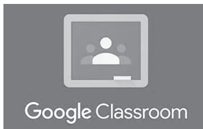
Рис. 1. Логотип сервісу Google Classroom

Перевагами дистанційного навчання визнано: інтерактивність – дозволяє швидко здійснювати доставку інформації, налагоджувати зворотний зв'язок; гнучкість програм – сприяє організації навчання в зручний час та в зручному місці; модульний принцип – дозво-