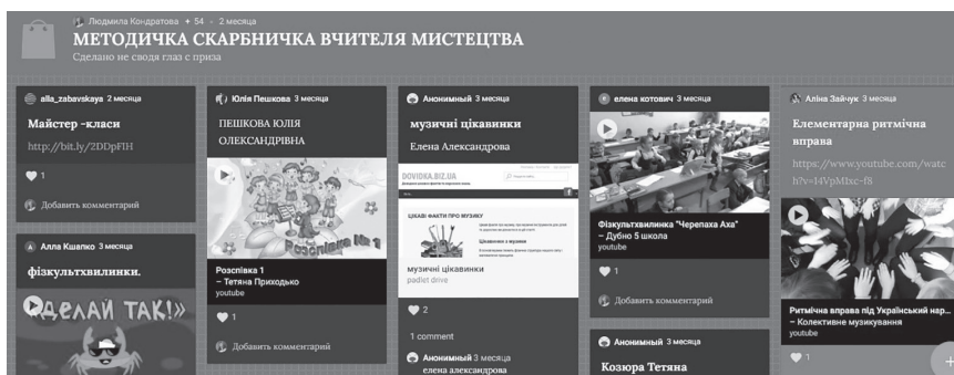
Рис. 3. Спільне завдання з методики мистецтва засобами інтерактивної дошки Padlet

Висновок. Всеукраїнський дистанційний курс для вчителів мистецтва, що запроваджувався на базі видавництва «Навчальна книга – Богдан», у період з 11.03 по 11.06.2019 р. і мав на меті підвищити рівень професійної компетентності й саморозвитку в сфері методики викладання мистецтва для учнів початкової школи на основі новітніх цифрових технологій, цифрових інструментів. Дистанційний курс дозволив підвищити рівень фахової педагогічної майстерності, професійної компетентності, розвинути здатність до професійного саморозвитку педагогів та отримати ґрунтовні творчі здобутки в межах електронного дистанційного навчання. Курс є авторським, його особливість полягає в опануванні методики викладання інтегрованого курсу мистецтва на засадах Нової української школи, комплексу новітніх педагогічно-мистецьких, цифрових технологій на основі дистанційної форми навчання у веб-середовищі Google Classroom.