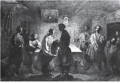
Фото 5. Т. Г. Шевченко. Старости. Серія «Живописна Україна». Офорт. Україна. 1844 р.

А. Цорн, В. Серов, І. Шишкін, А. Менцель, К. Кольвіц, Дж. Моранді, С. Далі.