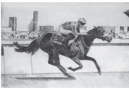
Фото 11. Диптих «Швидкість». Офорт. Ясенєва Єлизавета, 15 років. 2018 р.

Висвітлено особливості вивчення мистецтва графіки учнями різних віко-