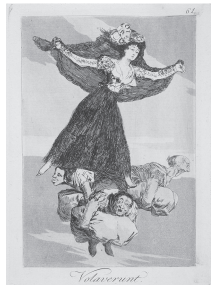
Фото 4. Ф. Гойя. «Каприз 61» (із серії «Капричос» (1793–1797). Офорт. Іспанія

У XIX ст. мистецтво офорта занепадає, витіснене появою друкарських технологій на кольоровій основі. Однак наприкінці XIX – на початку XX століть до техніки офорта звернулися французькі живописці – Ш.-Ф. Добін'ї, Каміль Коро, Едуард Мане. Також відомі своїми офортами художники Д. Уїслер,