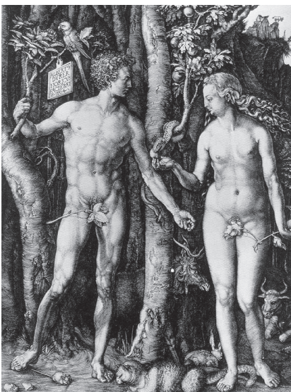
Фото 3. Альбрехт Дюрер. «Адам і Єва». Офорт. Німеччина. 1504 р.

Однією з різновидів гравюри (загальне значення друкованих графічних технік) є техніка офорта , що виникла і