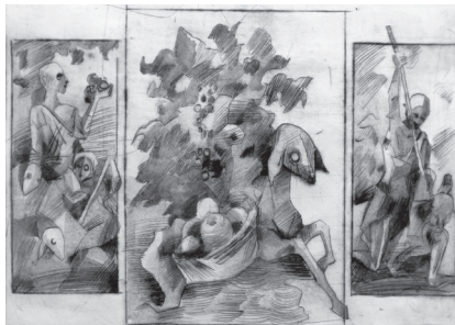
Фото 10. Триптих «Кайн та Авель». Офорт, акварель. Моїсеєнко Володимир, 16 років. 2016 р.

Офорт є технікою глибокого друку, тому при підготовці дошки до друку фарбу наносять вглиб штрихів шпателем. Надлишок фарби на поверхні дошки спочатку знімають шпателем, потім газетним папером до чистоти негравіюваної поверхні дошки. Фарба має залишатися тільки вглибині штрихів. Папір для друку офортів на кілька хвилин замочують в кюветі. Надлишок води