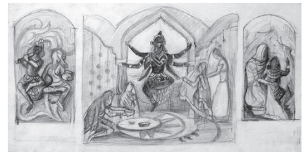
Фото 8. Триптих «За мотивами міфів Індії». Робочий картон. Остацьцева Софія, 15 років. 2016 р.