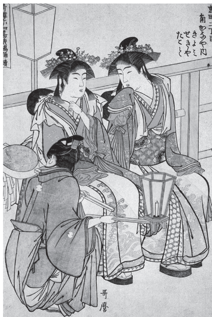
Фото 2. Кітагава Утамаро. Кольорова гравюра. Японія. XVII ст.

(Вікіпедія). У Західній Європі кольорова гравюра на дереві з'явилася на початку XVI ст. У цій техніці працювали Лукас Кранах (фото 1), Уго да Карпі, Ганс Бургкмайєр. Близько 1710 р. голландець Жак Крістофер Леблон вперше замінив дерев'яні дошки на металеві.