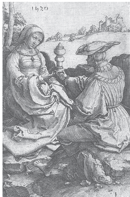
Фото 1. Лукас Кранах. Офорт. Німеччина. Поч. XVI ст.

Особливість гравюри полягає у можливості тиражувати художній твір. Оскільки естампна дошка виготовлена зазвичай із твердого матеріалу, це дозволяє віддруковувати значну кількість якісних відбитків. Відбиток на папері