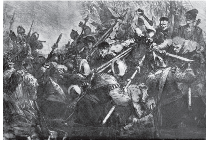
Фото 6. О. Г. Данченко. «Подвиг трьохсот під Берестечком». Офорт. Україна. 1954 р.

Учням пропонується виконати твір у форматі диптиха або триптиха та перевести його в зазначену техніку. Теми для виконання творів – сюжети з історії України та світу, обрядових свят і фольклору народів світу, літературних творів української та світової класики, біблійні сюжети, спорт, танець тощо. На виконання цього завдання відведено 9 занять (кожне заняття – це 2 уроки по 40 хвилин). Наведемо зміст занять і стилі методичні рекомендації щодо їх проведення: