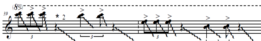
А. Корсун: «Aqua Sonare», т. 39-40

Передостанній, п'ятий розділ починається з варьованої теми, останній такт якої повторюється двічі, поєднуючи гру на чорних клавішах та використання глісандо від білих клавіш.