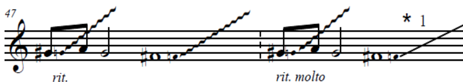
А. Корсун: «Aqua Sonare», т. 47-48

Також, у п'ятому розділі відбувається головна кульмінація твору. Глісандо виконуються двома руками, хрест на хрест, у двох діаметрально протилежних регістрах.