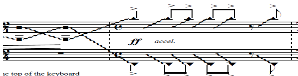
А. Корсун: «Aqua Sonare», т. 54-55

Шостий розділ, заключний, представляє увазі слухача поєднання трьох елементів (т. 6164): фактурно та ритмічно модифікований стукіт, глісандо без зазначеної звуковисотності, глісандо від заданих звуків та стукіт у первинному способі виконання, ритмічно змінений (друга половина т. 66).