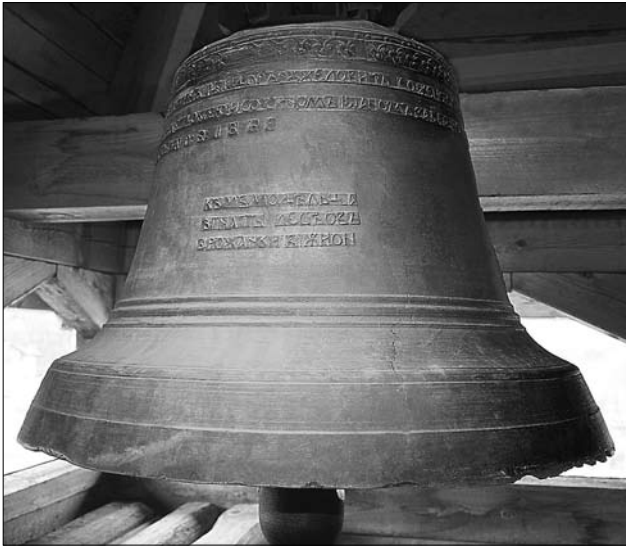
Дзвін 1868 року

людей на Службу Божу чи сповіщали про смерть. Досі зберігся великий дзвін (його зараз перевезли до нової дзвіниці), який відзначався силою і красою звучання, досконалістю форми і пропорцій, датований 1868 роком. Його виготовив місцевий майстер із сусіднього села Верхня Рожанка Гнат Лесів (1826 — 3.06.1890). Родичів Лесіва у селі й досі ідентифікують за прізвиськом «Дзвонарьові». Тут уперше подаю в оригіналі для наукової та широкої громадськості повний напис на дзвоні: