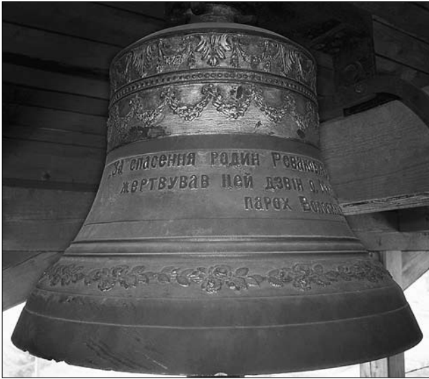
Дзвін 1927 року