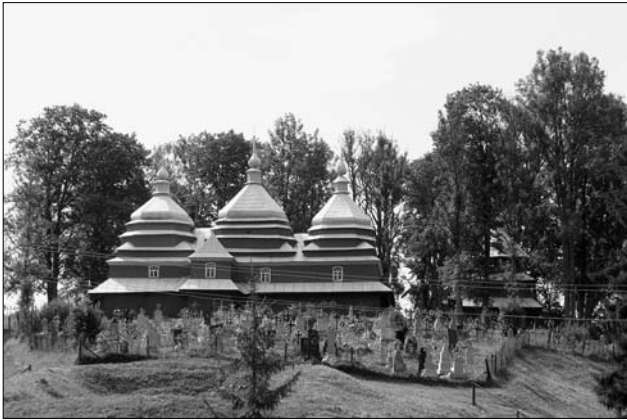
Церква Пресвятої Євхаристії у Волосянці. Сучасний вигляд

Мені пощастило познайомитися з метрикальною книгою Волосянки, що зберігається у місцевій церкві, у якій міститься інформація про мешканців села від початку XIX — до середини XX століття. Саме в ній знаходяться записи про родину Реваковичів під числом будинку № 60. Крім того, виявлено значну документальну та епістолярну спадщину у відділі рукописів Львівської національної наукової бібліотеки України імені В. Стефаника та Центрального державного історичного архіву України у Львові, яка проливає певне світло на ці особистості. В додаток використовувалися ще інші маловідомі джерела та література. Важливою мотивацією до написання пропонованої статті стала ювілейна дата — 200 років від дня народження Івана Реваковича.