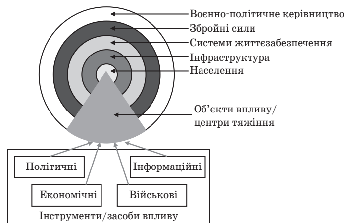
Рис. 3. Модель впливу, використана РФ у південно-східному регіоні України

Тактика «гібридної війни», застосована РФ в АРК, була з певними змінами поширена й на південно-східні регіони України (рис. 3). Так, основний вплив був зосереджений на населенні регіону. Наступними об'єктами впливу були державна інфраструктура та система життєзабезпечення відповідно. Четвертим і п'ятим шарами впливу стали Збройні Сили та воєнно-політичне керівництво України.