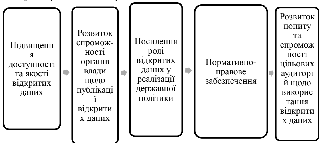
Рис 2. «Дорожня карта» розвитку відкритих даних в Україні

На рис. 2 відображено «Дорожню карту» розвитку відкритих даних в Україні, що містить 5 основних напрямків реалізації. Такими напрямками є підвищення доступності та якості відкритих даних, розвиток спроможності органів влади щодо публікації відкритих даних, посилення ролі відкритих даних у реалізації державної політики, нормативно-правове забезпечення процесу розвитку відкритості даних та розвиток попиту та спроможності цільових аудиторій щодо використання даних.