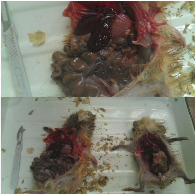
Рис. 2. Ураження печінки та брижі мурчаків, які загинули у біологічній пробі при дослідженні на псевдотуберкульоз.

кораблів, які були у контакті з гризунами, що є природними резервуарами збудника даної інфекції.