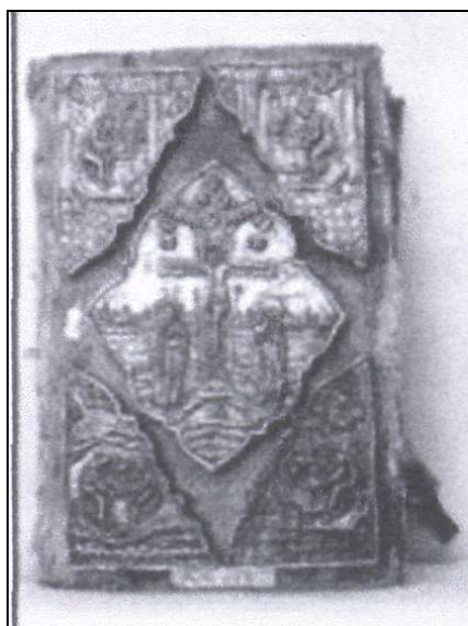
Фото 3. Євангеліє. Москва, 1626 р.