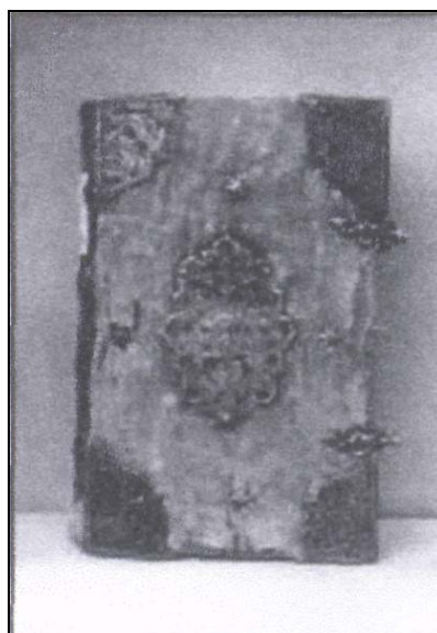
Фото 4. Верхня кришка Сдж-1051