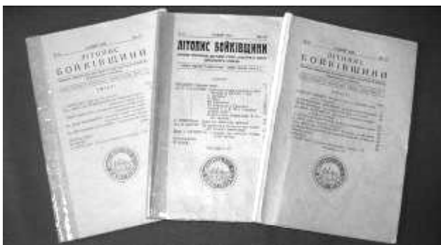
Видання «Літопису Бойківщини» 1931-1939 рр.