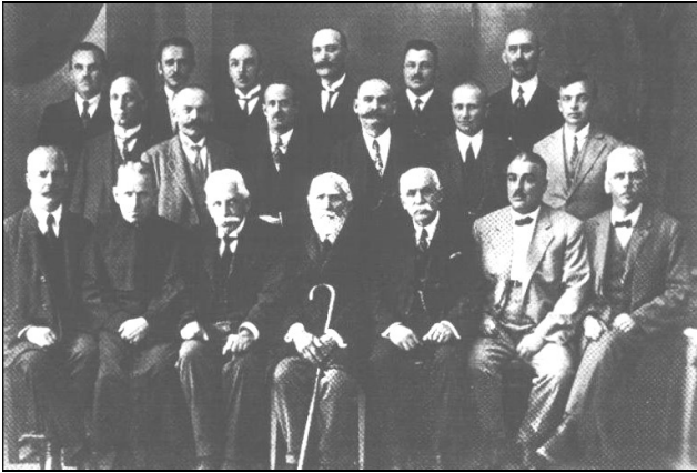
Члени Товариства та музею «Бойківщина», 1928

вати Товариство «Бойківщина», відбулося 9 жовтня 1927 року. Однак перші загальні збори, які формально утворили це Товариство, були скликані лише 16 червня 1928 року, після організаційної підготовки. Паралельно із утворенням Товариства «Бойківщина» у Самборі заснували й однойменний музей.