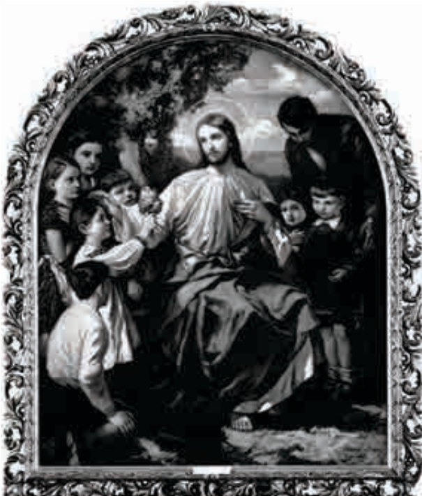
Йосип Бокшай. Христос серед дітей, 1933 р.