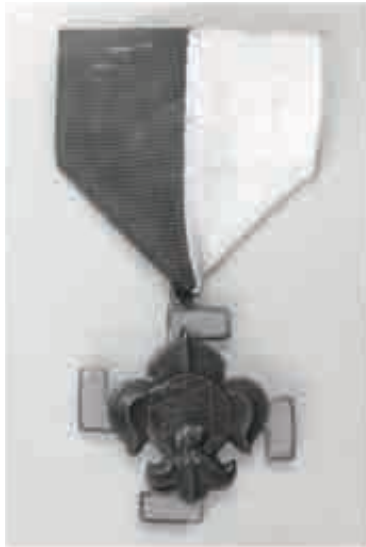
Відзнака першого пластового відзначення, виготовлена 1923 року за проектом Йосипа Бокшай