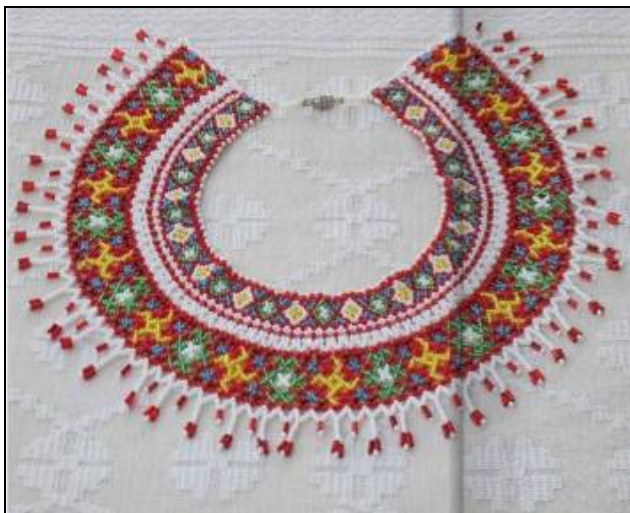
Іл. 1. Дводільна селянка-комір "Сварга". Матеріал: бісер, склярус, нитки. Техніка виконання: нанизування