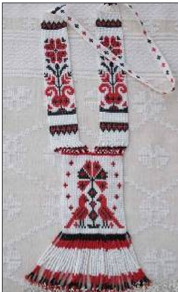
4. Гердан розетковий «Птахи». Матеріал: бісер, склярус, нитки. Техніка виконання: ткання

рального намиста, «венеціанського» намиста з гранатовим, бірюзовим, агатовим намистом у восьмишарове комбінаторне намисто. Одна з найулюбленіших