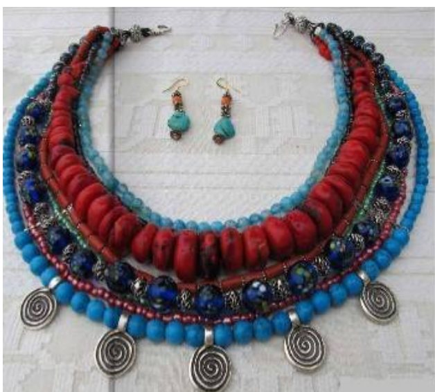
7. Намисто "Спіраль". Матеріал: бісер, гранат, бірюза, агат, корал, венеціанські намистини, нитки, металеві елементи. Техніка виконання: нанизання, набирання в разки