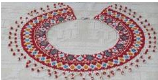
5. Криза "Лемко". Матеріал: бісер, склярус, нитки. Техніка виконання: нанизання.