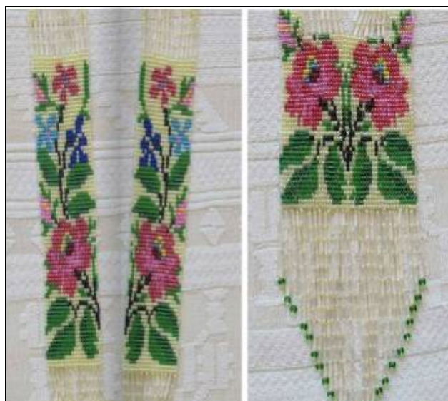
Іл. 3. Гердан розетковий «Вінок», Матеріал: бісер, склярус, нитки. Техніка виконання: нанизування, ткання

У композиції прикраси «Спіраль» мисткиня поєднала композиційні ознаки намиста, «пацьорок», ко-