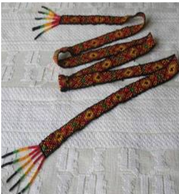
6. Гердан стрічковий "Безкінечник". Матеріал: бісер, склярус, нитки. Техніка виконання: нанизання, ткання