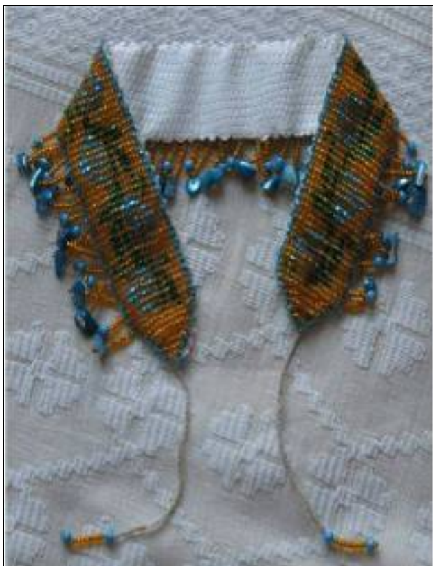
Іл. 2. Гердан стрічковий "Безкінечник". Матеріал: бісер, склярус, нитки. Техніка виконання: нанизування, ткання