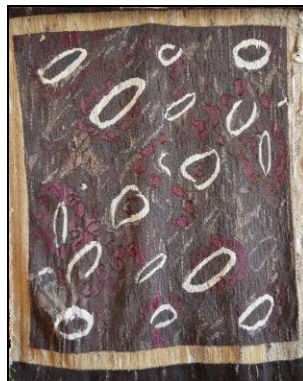
«Композиція № 1», 2005