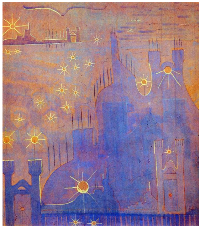
М. Чюрленіс. Анданте (Соната сонця), 1907

Стаття надійшла до редколегії 20 травня 2016 року