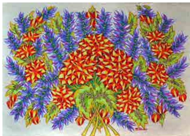
Три основні композиційні типи творів Параски Хоми