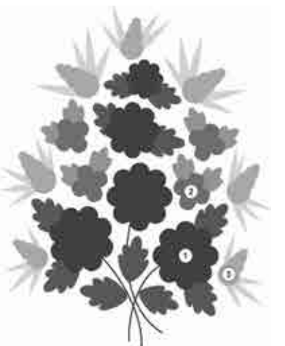
Схема 3. Букетний тип композиції