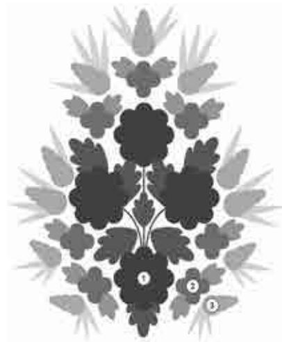
Схема 1. Замкнутий тип композиції