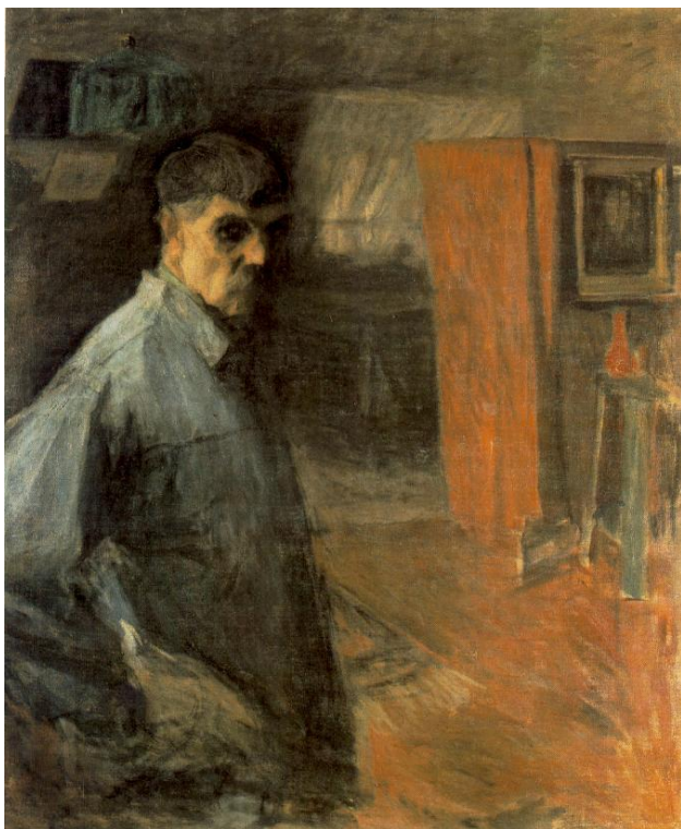
Ш. Голлоші. Автопортрет. Полотно, олія, 1916