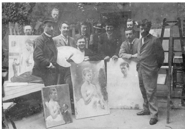
Шимон Голлоші з учнями. Мюнхен, 1894. Зліва направо: перший – Чонтварі Костка Тівадар, восьмий – Шимон Голлоші, одинадцятий – Олександр Мурашко (?)

Стаття надійшла до редколегії 27 березня 2017 р.