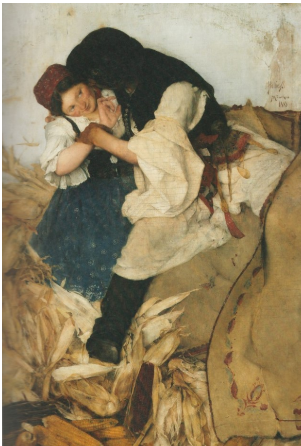
Ш. Голлоші. Лушчіння кукурудзи. Полотно, олія, 1885