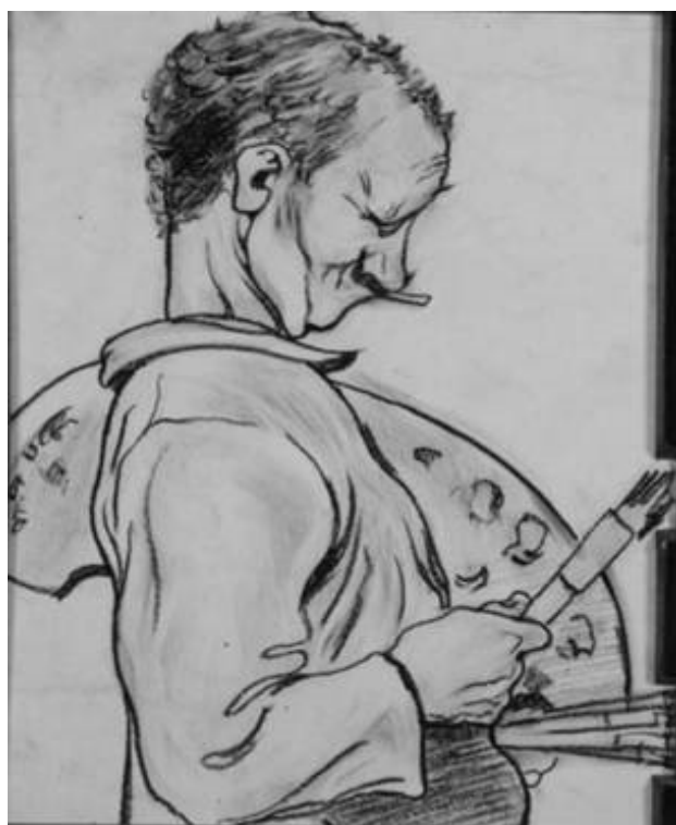
Дюла Вароді. Автопортрет