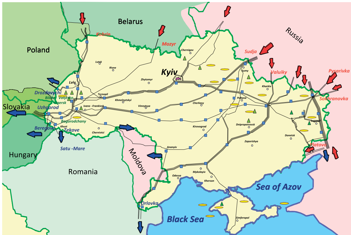
Рис. 1. Магістральні газопроводи в Україні

більш ефективні. Активному процесу розвитку кластерів, який посилюється з початку 2000-х років, передували розвиток аутсорсингу в промисловості, глобалізація ринків, підвищення технологічної складності виробництва.