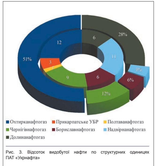
Рис. 3. Відсоток видобутої нафти по структурних одиницях ПАТ «Укрнафта»

ності нагнітальних свердловин шляхом очищення за- кольматованої привибійної зони.