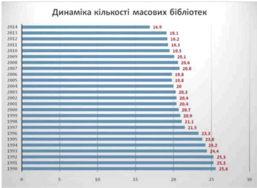
Рис. 2. Динаміка зменшення кількості бібліотек

Певні проблеми та виклики існують і в системі освіти. Серед них слід виділити: