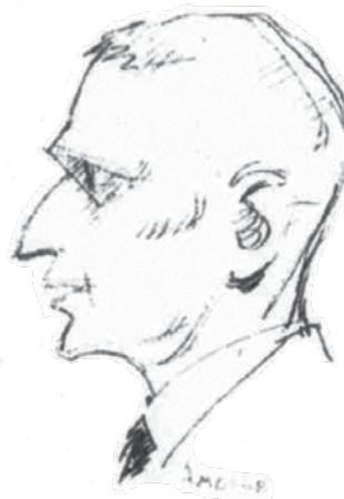
Николай Амосов. Рисунок с натуры Народного художника Украины Сергея Подервянского, 1958 год

На старинной киевской Фундуклеевской улице (затем улица Ленина, а ныне — Богдана Хмельницкого), в угловом, ничем не примечательном доме на пере-