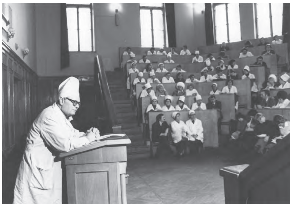
Рис. 2. Лекція з госпітальної терапії для студентів