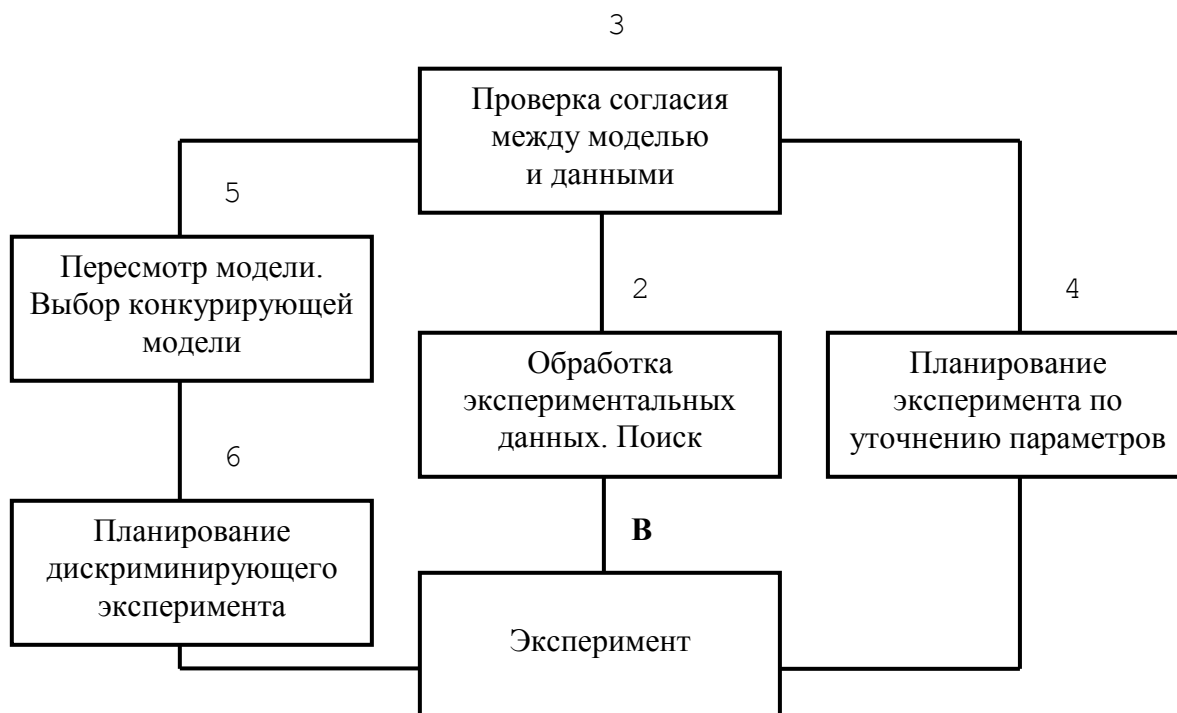
Рис.2. Последовательный процесс поиска математической модели

экспериментальных данных наименьшую совокупность возможных моделей. Последовательный процесс поиска математической модели представлен на рис.2.