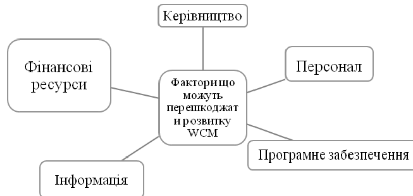
Рис. 2. Фактори, що перешкоджають розгортанню WCM

необхідно по-різному описувати переваги, ризики, проведені зміни і можливості, які несе з собою процес впровадження виробничої системи.