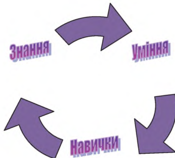
Рис. 2. Складові поняття «термінологічна компетентність»

Термінологічна компетентність виражає значення традиційної тріади «знання–уміння–навички», інтегруючи їх у єдиний комплекс (рис. 2). Цей аспект має важливе значення, оскільки сприяє цілісній підготовці фахівців бібліотечної галузі, розвиває їхню професійну культуру, комунікативну компетентність.