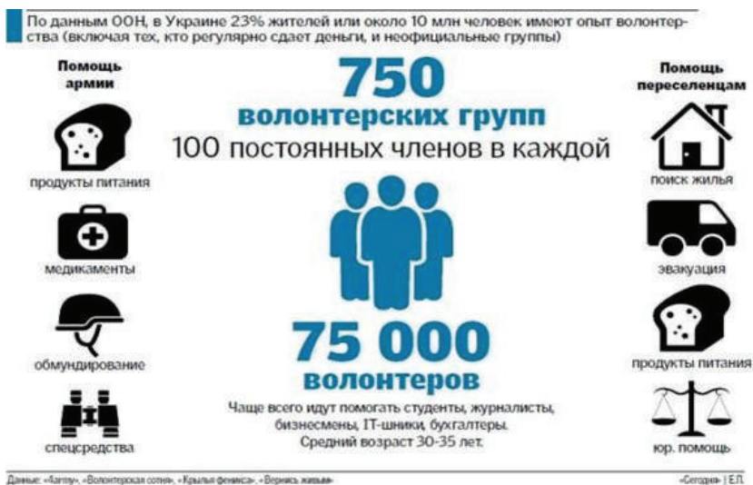
Рис. 2. Кількість волонтерів в Україні

За даними дослідження GfK Ukraine, проведеного в листопаді 2014 р. на замовлення Організації Об'єднаних Націй в Україні, майже чверть українців (23 %) мали досвід волонтерства; 9 % українців почали займатися волонтерством протягом останнього року; основним напрямом діяльності волонтерів у 2014 р. стала допомога українській армії та пораненим – цим займалося 70 % волонтерів [12] (рис. 2).