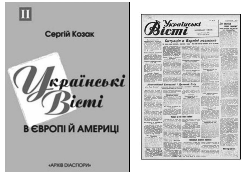
Рис. 4. «Українські вісті» в Європі й Америці

«Українські вісті» в Європі й Америці» [10] – бібліографічний показчик змісту унікального часопису, в якому представлено найбільш повну картину життя української діаспори від середини ХХ до початку ХХІ ст. Основна частина показчика – повний зміст номерів газети за хронологією. Допоміжний апарат – пояснення скорочень назв установ, об'єднань, періодичних видань, словник криптонімів і псевдонімів, іменний показчик.