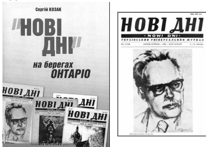
Рис. 3. «Нові дні» на берегах Онтаріо

«Нові дні» на берегах Онтаріо» [7] – показчик змісту часопису «Нові дні». Матеріал основної частини показчика викладено в хронологічній послідовності і супроводжується поясненнями автора. Допоміжний показчик – іменний. Доцільно було б зробити допоміжний предметний показчик, оскільки хронологічна побудова ускладнює тематичний пошук інформації.