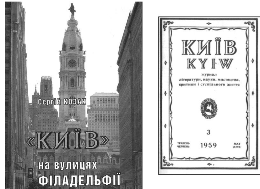
Рис. 2. «Київ» на вулицях Філадельфії

Посібник «Київ» на вулицях Філадельфії» [6] включає хронологічний та систематичний покажчик змісту літературно-мистецького часопису (а з 1954 року – журналу літератури, науки, мистецтва, критики і суспільного життя) «Київ». Допоміжний апарат – алфавітний покажчик авторів та покажчик імен.