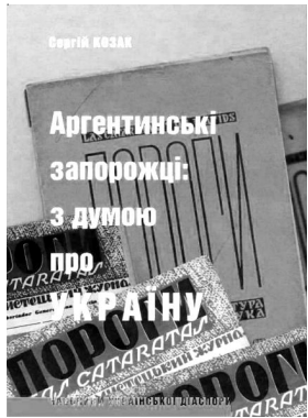
Рис. 1. Аргентинські запорожці: з думою про Україну

Видання «Аргентинські запорожці: з думою про Україну» [1] вміщує хронологічний та систематичний покажчик змісту літературно-мистецького журналу «Пороги». Допоміжний апарат – алфавітний покажчик авторів та покажчик імен.