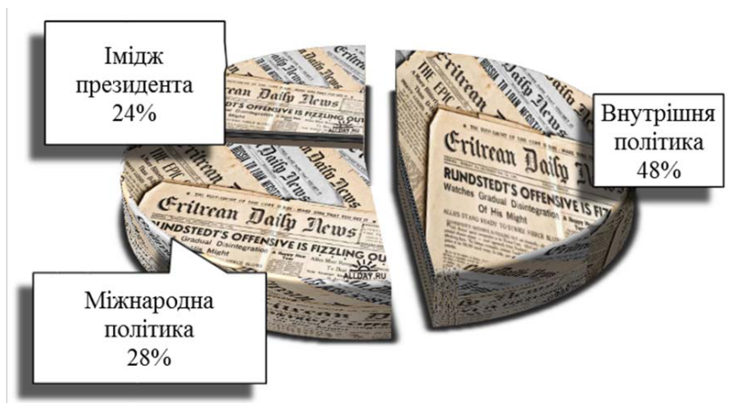
Рис. 1. Доля сфер діяльності президентів світу в повідомленнях ресурсів Інтернету за 2019 р.

(13 %); у багатьох матеріалах оглядачі коментують відносини президента країни з органами законодавчої (12 %) та виконавчої влади (12 %).