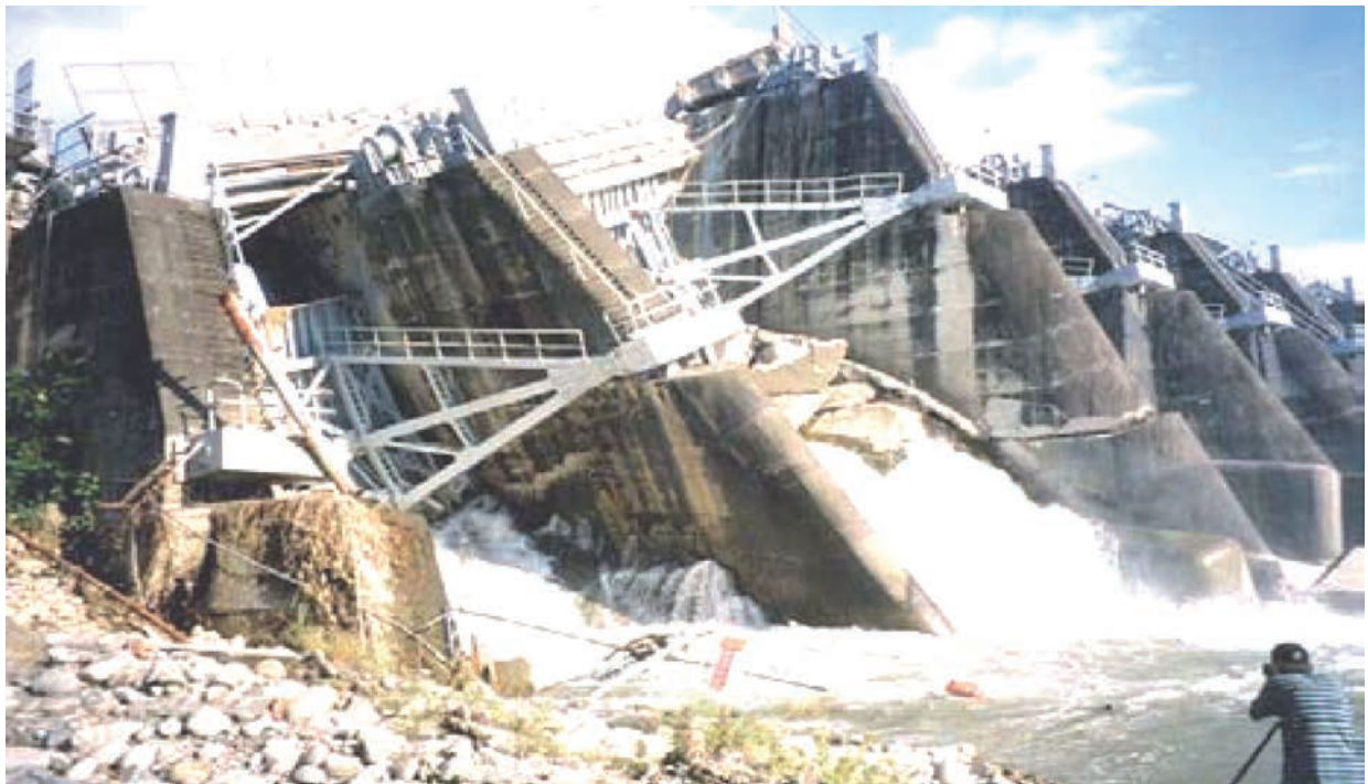
Рис. 4. Аварія на греблі Шіх Канг під час землетрусу, (Тайвань), висота 25 м, 1999 р.