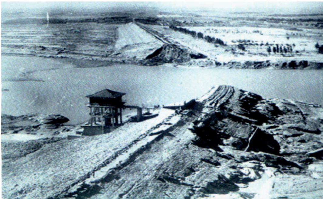
Рис. 2. Аварія на греблі Баньцяо, (Китай), 1975 р., висота греблі 118 м, загинуло біля 26 тис. людей, 145 тис. померло внаслідок голоду й епіdemій, зруйновано 5 960 000 будинків, постраждало майже 11 млн. осіб

небезпечною аварією на ГТС є гідродинамічна аварія, ознакою якої є поширення з великою швидкістю значних мас води, що створює загрозу виникнення техногенної надзвичайної ситуації. Гідродинамічна аварія може виникнути під час руйнування гребель, дамб, шлюзів, затворів, розгерметизації напірних трактів, при зсувах