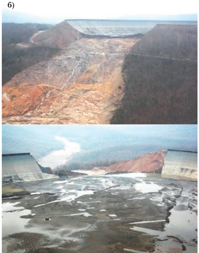
Рис. 5. Верховий басейн ГАЕС Таум Саук (США, 2005 р.): до аварії (а) та після (б)