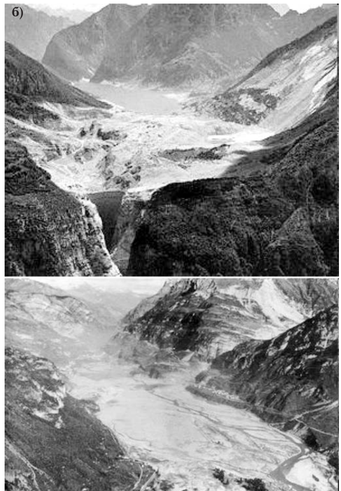
Рис. 6. Вид на греблю Вайонт, (Італія), висота 262 м, до аварії (а) та після аварії (б) у 1963 р., загинуло майже 3000 осіб