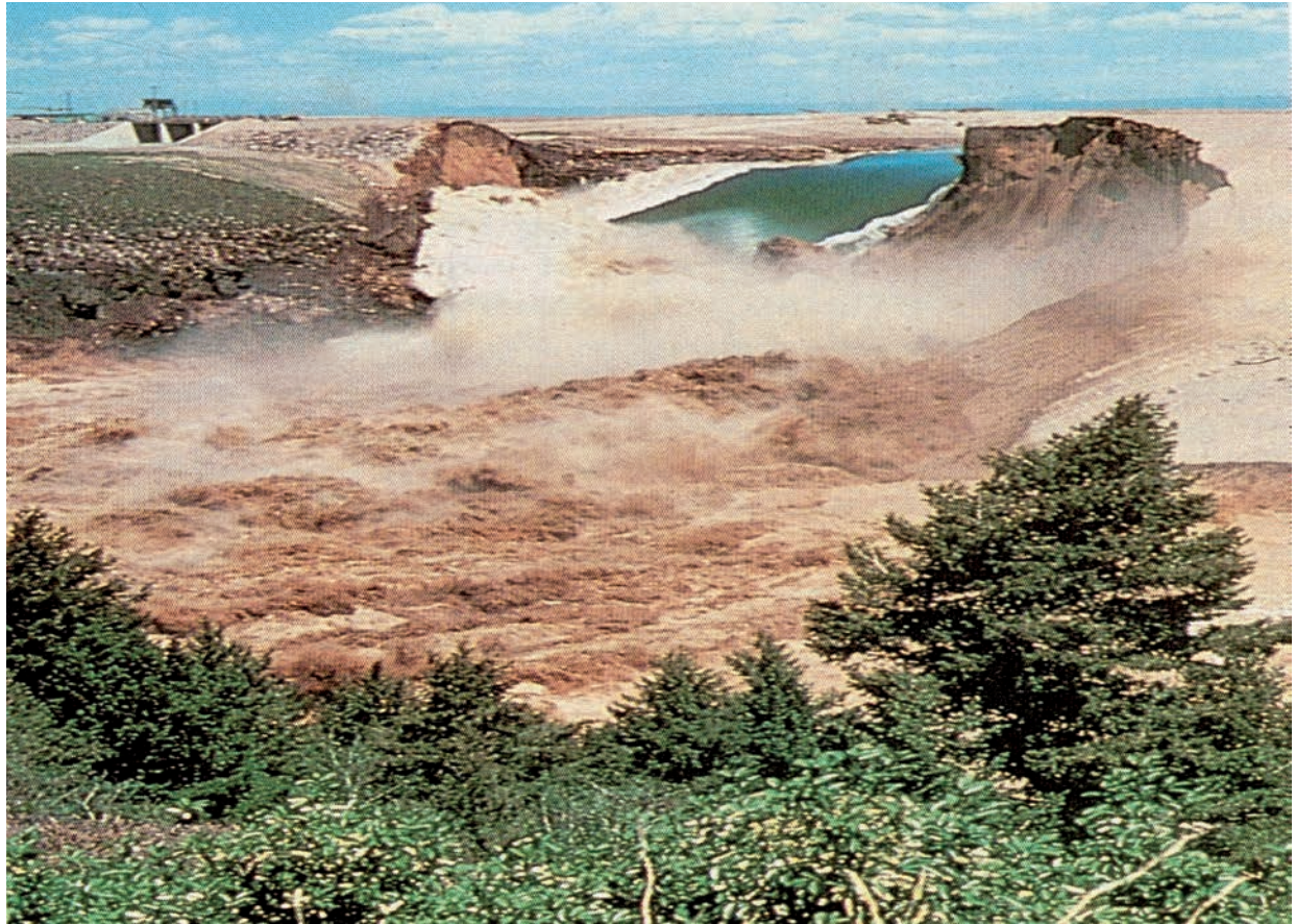
Рис. 3. Руйнування греблі Тетон (США) в 1976 р., висота 93 м, загинуло 11 осіб.