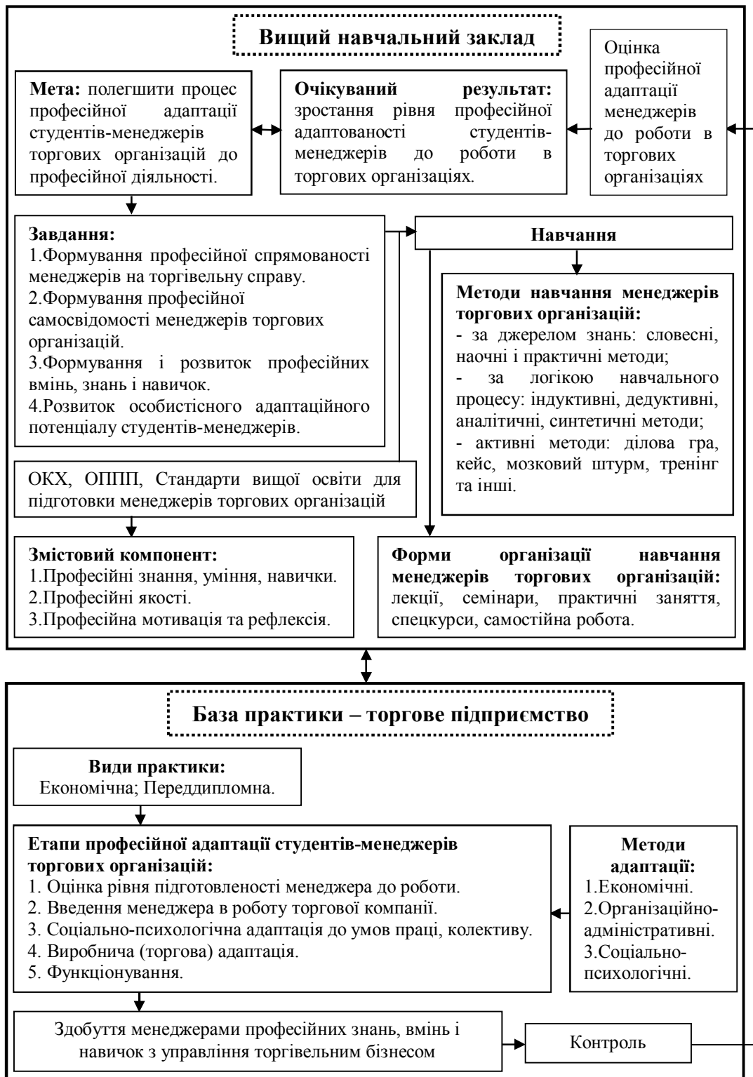
Рис. 1. Модель адаптації менеджерів торгових організацій до професійної діяльності