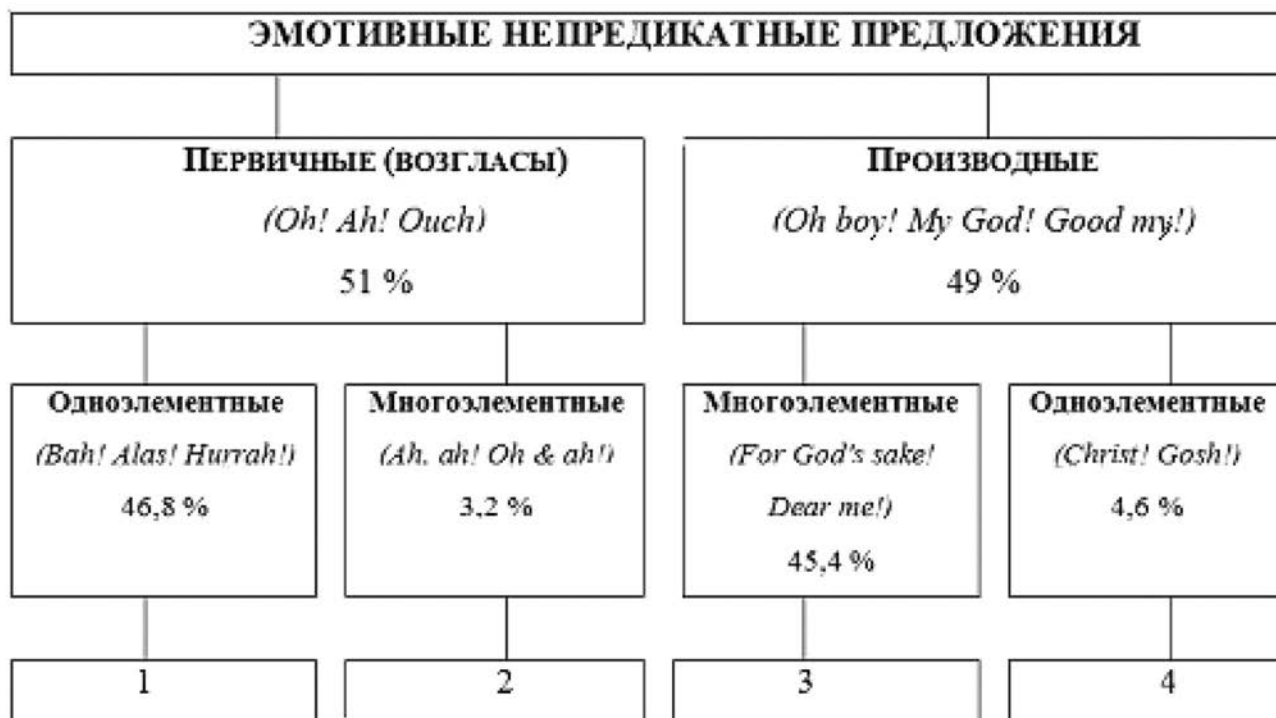
Рис. 2. Генезис эмотивных непередикатных предложений