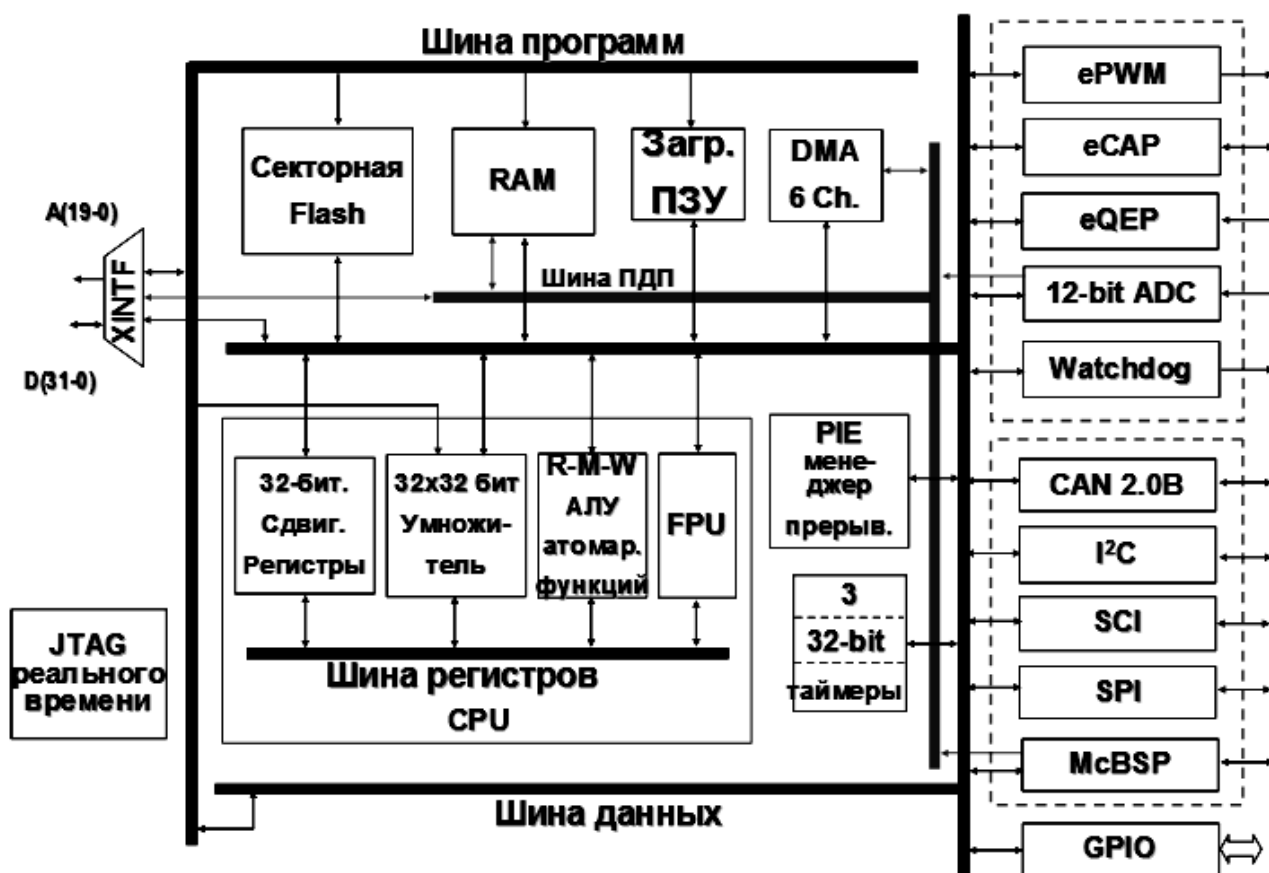
Рис. 3. Блок-схема контроллера TMS320F2833x

– создание микроконтроллеров со сдвоенными менеджерами событий для прямого цифрового управления приводами по системе: «Активный выпрямитель – Инвертор – Двигатель» и «Преобразователь постоянного напряжения в постоянное – Инвертор – Двигатель», а также для управления двухдвигательными приводами.