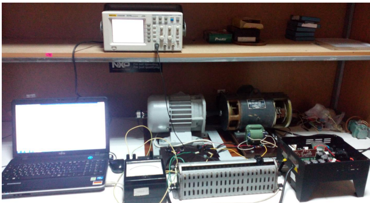
Рис. 1. Внешний вид стенда

Для исследования возможностей управления электродвигателем на основе современных микропроцессорных компонентов на кафедре «Электромеханические системы автоматизации» был разработан стенд (рис. 1), включающий асинхронный электродвигатель серии АИР 71А4УЗ, двигатель постоянного тока серии 2ПН90МУХЛ4 (используемый в качестве нагрузки).