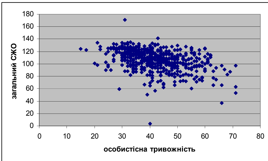
Рис. 3. Кореляційне поле залежності загального показника осмисленості життя та особистісної тривожності, p \leq 0,05 .

Відзначаються позитивні кореляційні зв'язки загального показника осмисленості життя зі змінними регуляторно-характерологічної сфери: «емоційна стійкість» ( r = 0,28 при p \leq 0,05 ), «сміливість» ( r = 0,26 ), «афектотимія» ( r = 0,26 ), «експресивність» ( r = 0,26 ). З'являється ще один зв'язок – зі змінною «сумлінність» ( r = 0,29 ), яка тісно є пов'язаною з осмисленістю життя людини. В. Франкл визначає сумлінність як смисловий орган, який допомагає людині знайти смисл у відповідності до цінностей. Спостерігається зворотний кореляційний зв'язок загального показника осмисленості життя з такими регуляторно-характерологічними властивостями, як: особистісна ( r = -0,38 ) та реактивна тривожність ( r = -0,34 ).