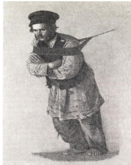
Рис. 3. Верещагін В. Бурлак у фуражці. 1866 р.

Ще одним цікавим елементом гардеробу, який згадується у переліку одягу для хлопчиків, був літній халат – предмет напівдомашнього образу із пестряді – дешевої тканини, яка виготовлялася із залишків пряди різної якості (льон, шерсть) та різного кольору, що мала злегка шерстку поверхню. Колір зазвичай був строкатий, інколи в дрібну клітинку.