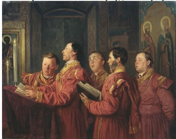
Рис. 6. Маковський В. Є. Півчі на кліросі 1870 р.

Відомий російський художник XIX століття, член Петербурзької Академії художніх мистецтв Володимир Єгорович Маковський у своїй картині «Півчі на кліросі» (рис. 6) [Маковський, 1870] зобразив хористів в урочистому вбранні під час богослужіння. На цій картині зображено п'ятьох дорослих чоловіків одягнених у яскраві червоні кунтуші, прикрашені позолоченими стрічками вздовж коміра, на рукавах та на плечах, а також із золотистими китицями. Картина зберігається у Севастопольському художньому музеї ім. М. П. Крошицького.