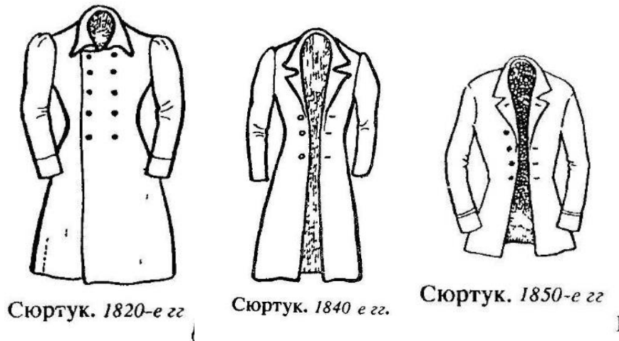
Рис. 1. Сюртуки. XIX століття

повстяноподібний застил, що закриває переплетення ниток [Словник української мови, 1978: 831].