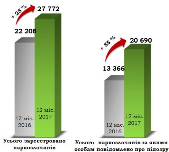
Реєстрація наркозлочинців та встановлення за ними осіб