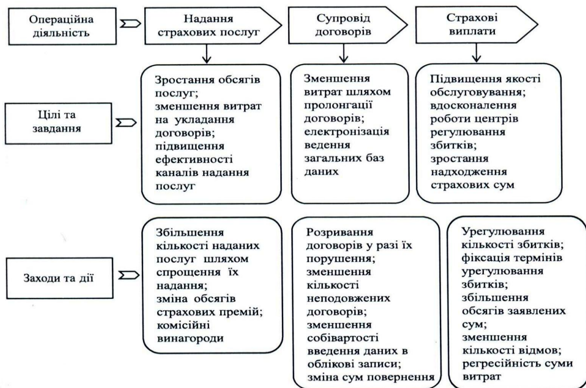
Рис. 1. Заходи підвищення рівня конкурентоспроможності послуг компаній – учасниць страхового ринку [5; 6]

де K_i – показники конкурентоспроможності окремих сторін діяльності страхової організації загальним числом N ;