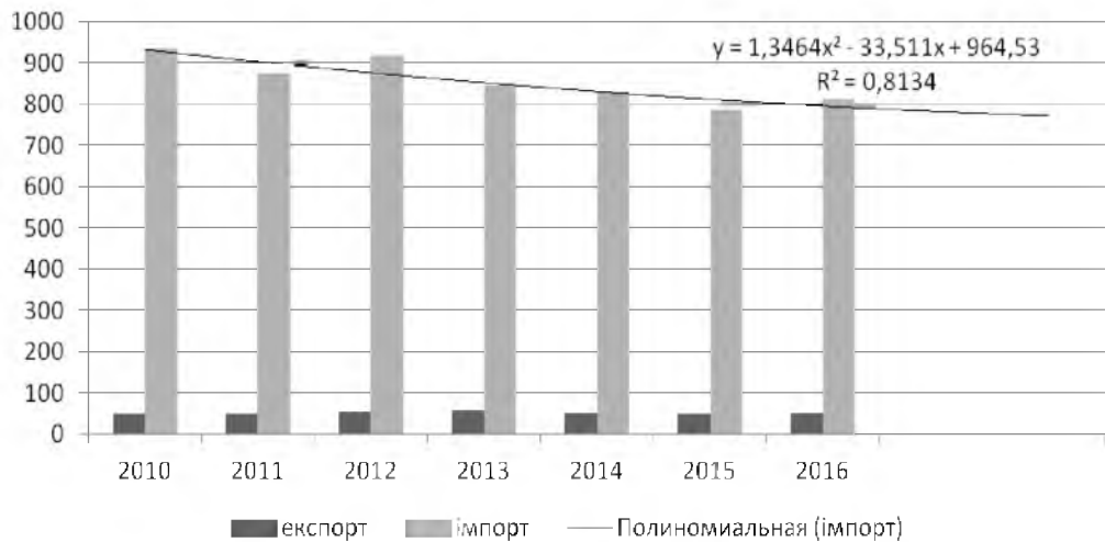
Рис. 3. Динаміка українсько-польської інвестиційної співпраці (млн дол.)

На рис. 3 показано динаміку українсько-польської інвестиційної співпраці, яка оцінювалась за співвідношенням між прямими інвестиціями з Польщі в економіку України та прямими інвестиціями з України в економіку Польщі.