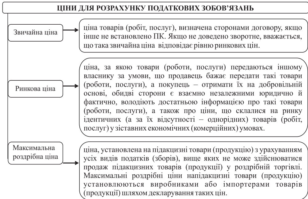
Рис. 1. Види ціни для розрахунку податкових зобов'язань за податками і зборами

Базою для розрахунку податкових зобов'язань за податками і зборами є ціна на товари, роботи (послуги). Відповідно до Податкового кодексу України (далі – ПК), для розрахунку застосовується звичайна, ринкова, максимальна роздрібна ціна (рис. 1).