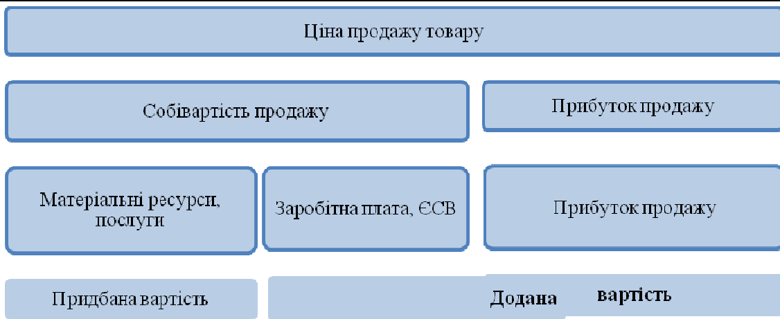
Рисунок 2 – Схема ціноутворення

Вважається, що додана вартість складається з витрат на оплату праці, відрахувань на соціальне страхування і прибутку від продажу. Деякі автори до структури доданої вартості включають амортизаційні відрахування [2; 3, 171]. Світовий О.М. вважає, що додана вартість може бути розрахована на валовій та чистій основах, тобто до і після виключення амортизаційних відрахувань [4, 265]. Однак, на нашу думку, для визначення сутності поняття доданої вартості суму амортизації слід розглядати у складі придбаної вартості матеріальних ресурсів зокрема тих, що використовуються більше одного року для виробництва товару (робіт, послуг).