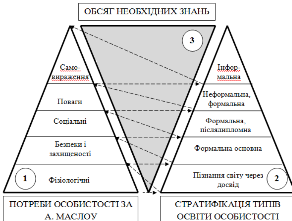
Рисунк 1 – Концептуальна модель взаємозв'язку між потребами (за А. Маслоу), які спонукають людей до дій, спрямованих на їх задоволення, а також мотивації здобуття необхідних для задоволення цього рівня потреб типу освіти і обсягу знань (пропозиція автора)

В зв'язку з цим, стає очевидною особлива роль формальної, неформальної та інформальної освіти в створенні можливостей задоволення особою потреб трьох вищих рівнів, які формують її домінуючі мотиви поведінки і названі К. Альдерфером потребами «зв'язку» (соціальні і поваги) та «росту» (самовираження).