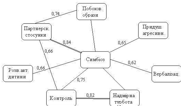
Рис. 1. Кореляційна плеяда 1

стовірної перевірки результатів кореляційного аналізу ми скористалися графічним методом кореляційних плеяд (рис. 1, 2), де: - це r \leq 0,05 ; -- це r \leq 0,01 .