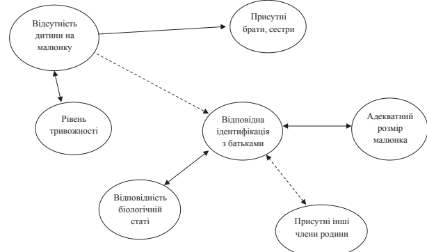
Рис. 2. Структура кореляційних зв'язків між ідентифікацією та рівнем тривожності

Отже, чим вищий рівень тривожності у дітей, тим розмір зображень буде неадекватним по відношенню до малюнка, а фігура батька буде відсутньою. Це дозволяє стверджувати, що становлення емоційно-ціннісного ставлення дитини до себе, як основного процесу розвитку самосвідомості, дійсно визначається якісним рівнем спілкування та її взаємодії з батьками.