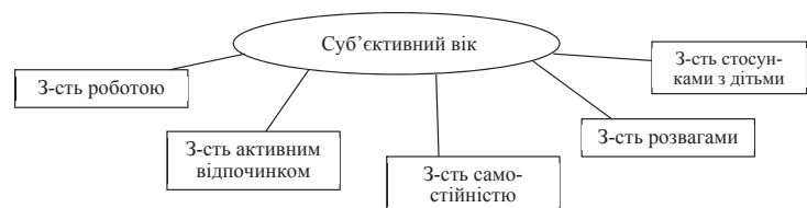
Рис. 2. Зв'язки показників суб'єктивного віку та задоволеності життям у літніх чоловіків (З-сть – задоволеність)

У літніх жінок кореляція сприймання віку та задоволеності життям більш різноманітна. Окрім описаних вище для чоловіків, у них показник різниці паспортного та суб'єктивного віку пов'язаний із загальною задоволеністю життям ( r=0,31 ), задоволеністю стосунками з друзями ( r=0,34 ), со-