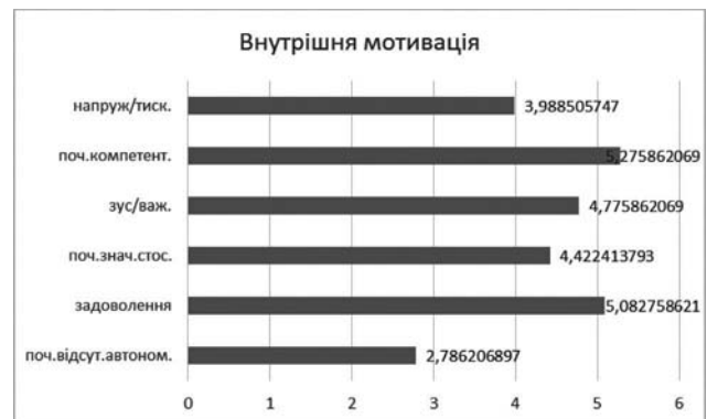
Рис. 2. Усереднені дані внутрішньої мотивації професійної перекваліфікації

За отриманими даними можемо виокремити найбільш виражені мотиви професійної перепідготовки: задоволення, почуття компетентності та мотив пізнання нового, які є складовими внутрішньої мотивації, та мотивація ідентифікації, що відноситься до внутрішньо регульованих зовнішніх мотивів. Важливо також зазначити низький рівень за шкалою відсутності автономії, що свідчить про відчуття здійснення вибору, можливості впливу та регуляції навчальної діяльності. Тому можемо зробити висновок, що в структурі мотивації професійної перепідготовки безробітних переважають внутрішні мотиви, що підтверджує нашу першу гіпотезу.