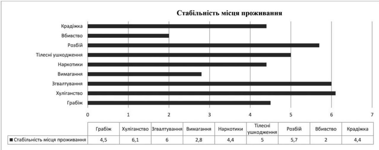
Рис. 2. Показник «Стабільність місця життя» засуджених за різні види злочинів

очно показник «Автономності в професії» в засуджених за різні типи злочину показаний на рисунку 1.