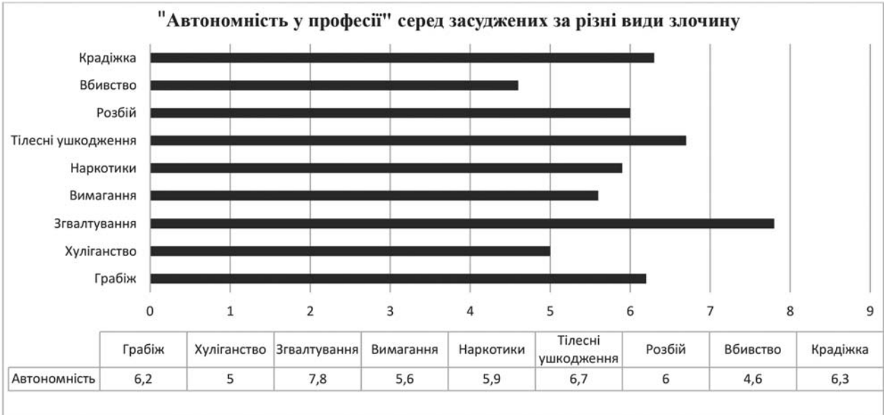
Рис. 1. Показник «Автономності у професії» у засуджених за різні види злочинів